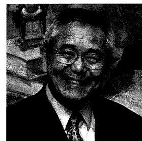
米パデュー大学 根岸 英一特別教授 (帝人グループ名誉フェロー) 帝人久村奨学生第5回生(1957年)

そして自らの「夢」を見つけたら真理を突き詰めるまで、とことんチャレンジしてください。今後の皆さんの大いなる活躍に期待しています。