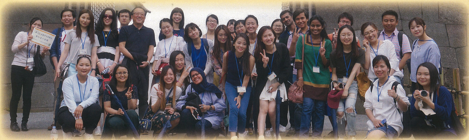
2016・2017年度奨学生(2017年度奨学生研修会)