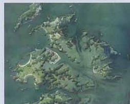
上空から見た浦戸諸島

するか)がどのような要因によって決定されるのかという問題が提起され、生態学の中の課題の一つとして多くの研究が行われてきました。近年は、生物多様性の保全の必要性から、この問題は多くの注目を集めています。最近の研究は、多様な生物が存在するほど生態系が安定性に保たれ、人間社会がさまざまな恩恵を生態系から得ていることを示しています。