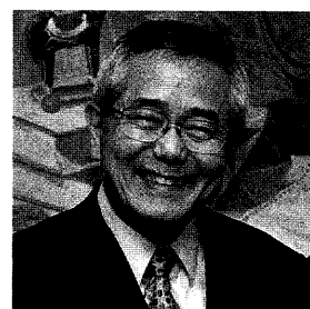
米パデュー大学 根岸 英一特別教授 (帝人グループ名誉フェロー) 帝人久村奨学生第5回生(1957年)

そして自らの「夢」を見つけたら真理を突き詰めるまで、とことんチャレンジしてください。今後の皆さんの大いなる活躍に期待しています。