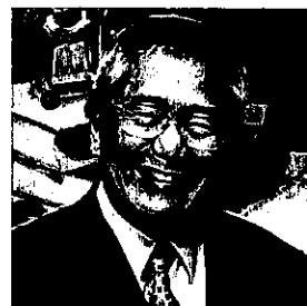
米パデュー大学 根岸 英一特別教授 (帝人グループ名誉フェロー) 帝人久村奨学生第5回生(1957年)

そして自らの「夢」を見つけたら真理を突き詰めるまで、とことんチャレンジしてください。今後の皆さんの大いなる活躍に期待しています。