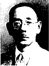
帝人奨創業者 久村 清太氏 (1880～1951)

公益財団法人帝人奨学会は、1953年6月の帝人株式会社創立35周年を記念した「帝人奨学会久村奨学生制度」を端緒として発足しました。翌1954年、この制度の一層の発展を期すため、奨学金事業を主事業として、財団法人帝人奨学会を設立しました。その後2011年に内閣総理大臣の認可を得て「公益財団法人帝人奨学会」に改組し今日に至っております。