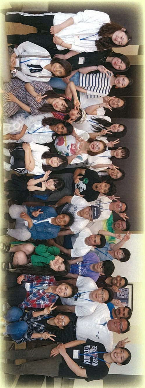
2019年度奨学生倉敷研修会にて(2018・2019年度財団奨学生)