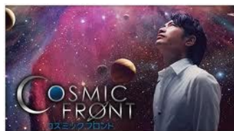
【コスミックフロント】 「大地創造」「重力レンズ」 「24時間オーロラ」など