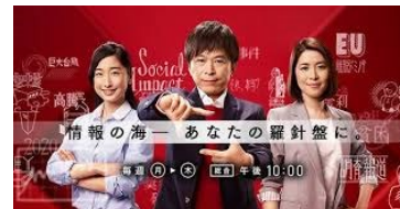
【クローズアップ現代+】 「小林益川理論」「アルマ望遠鏡」 「九州豪雨」など