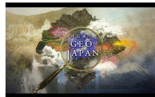
【ジオ・ジャパン】 (2017年) 【ジオ・ジャパン2】 (2020年)

申込みURL (11/3締切) : https://forms.gle/vhwSSUTf7FhjoNRi9 問い合わせ先 : syde-seminar@grp.tohoku.ac.jp