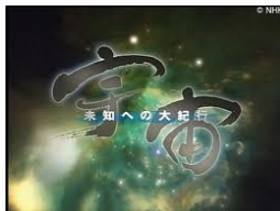
【宇宙 未知への大紀行】 (2001年)