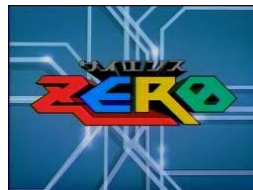
【サイエンスZERO】 「膜宇宙論」「錯覚」 「レアアース泥」など